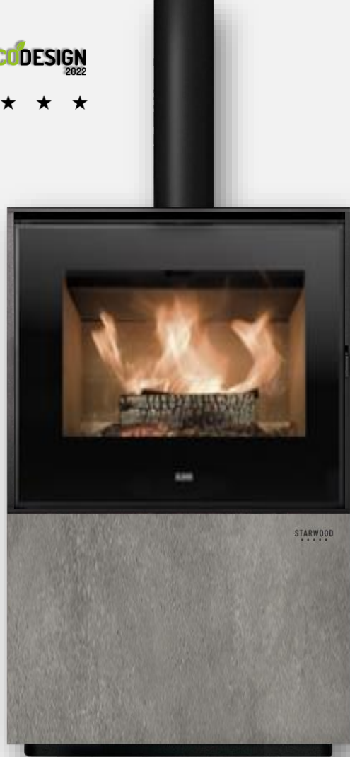
VENUS PLUS Le poêle à bois